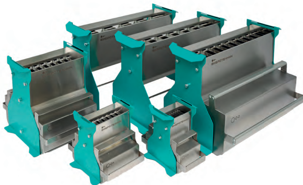
ДП 5, ДП 10, ДП 15, ДП 25, ДП 37,5 и ДП 50